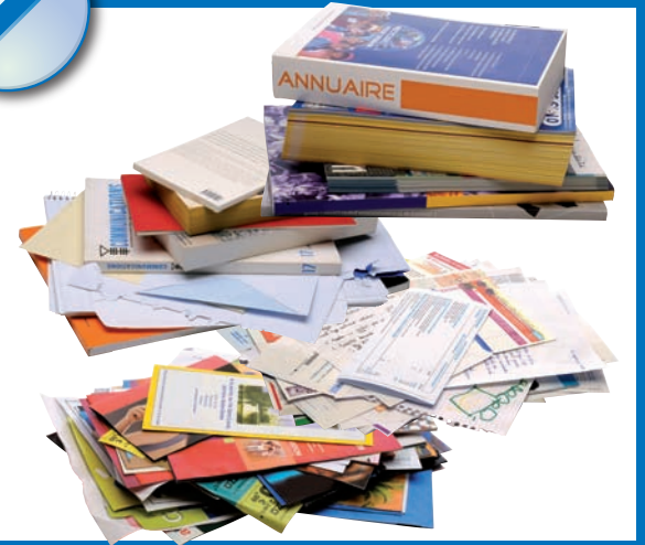
Le papier propre (journaux, revues, enveloppes...)