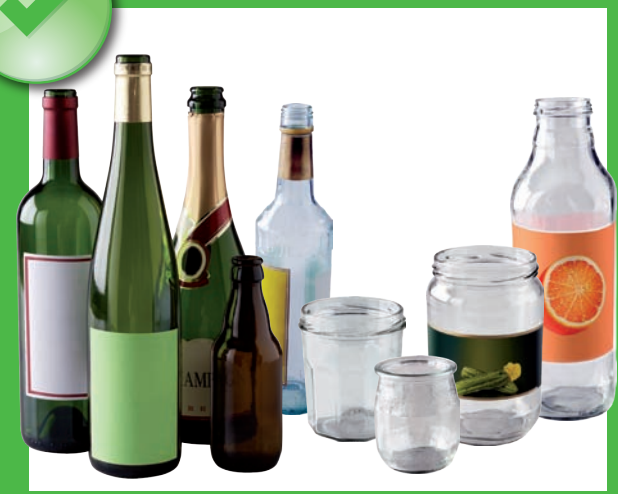
Bouteilles, bocaux et pots en verre