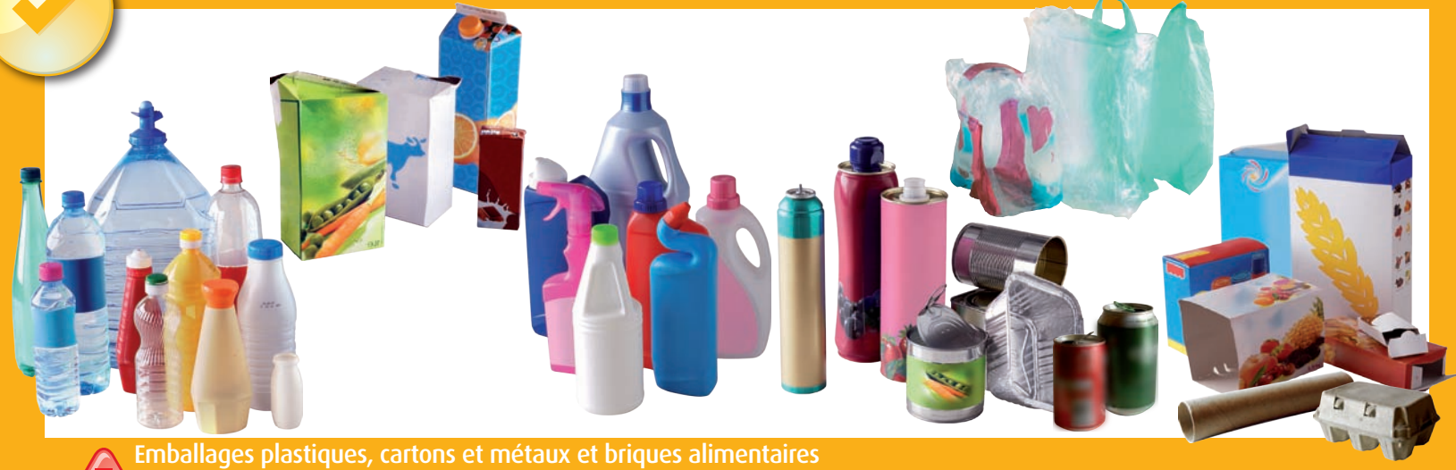
Emballages plastiques, cartons et métaux et briques alimentaires